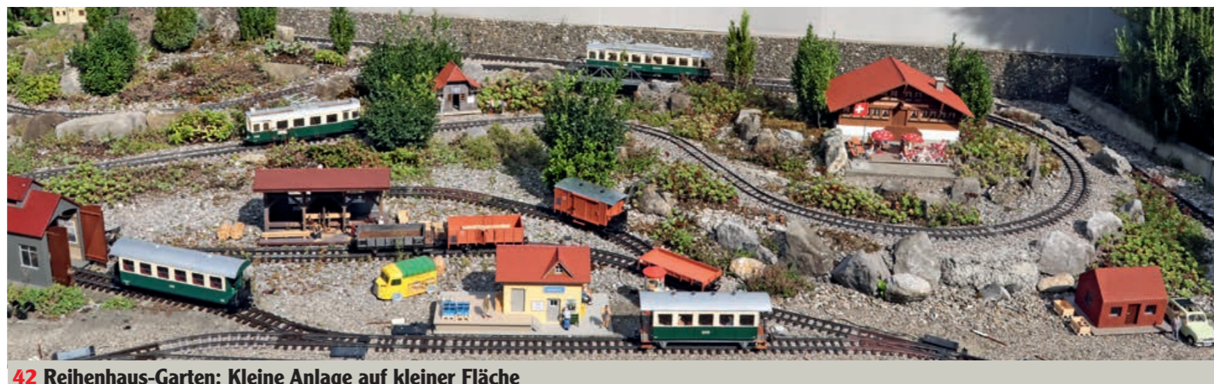
42 Reihengarten: Kleine Anlage auf kleiner Fläche